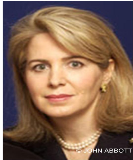
Prof Renee Mauborgne